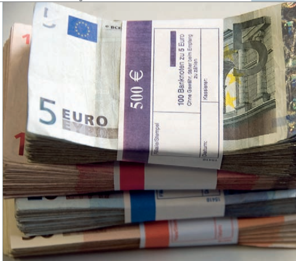
BARES GELD kostet so manchen Planer der Wegfall des Paragraphen 21 der alten HOAI.