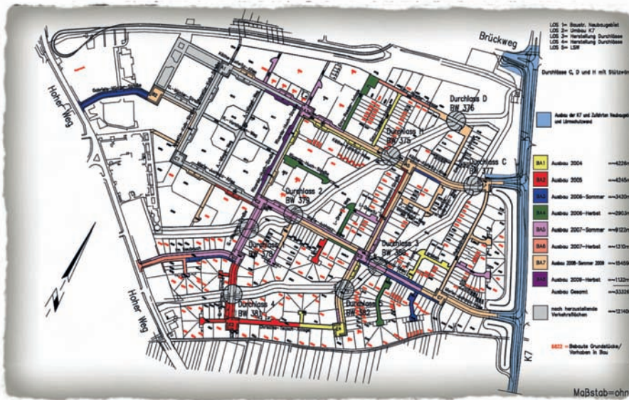
Abb. 4: ... mit dieser Baugebieterschließung mit konkreten Zahlen gefüllt.